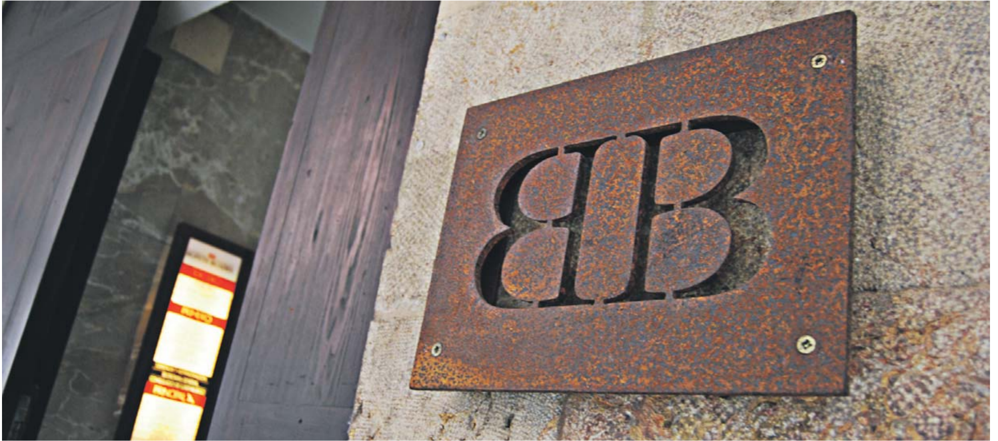
■ Die Anwaltskanzlei wurde 1979 gegründet.